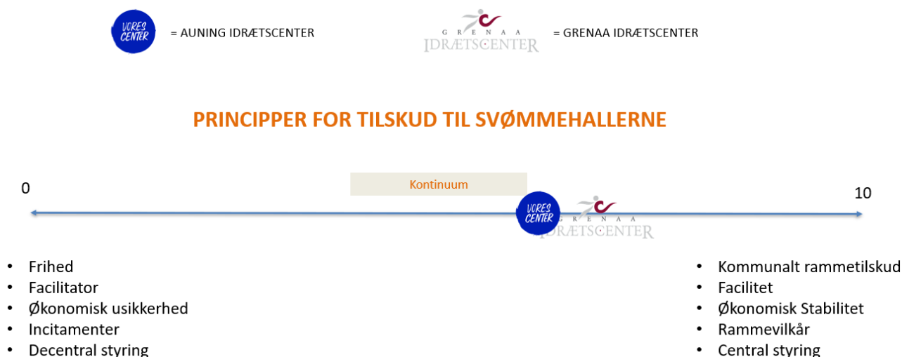
Figur 1 – Kontinuum for tilskud

Igennem processen har vi diskuteret grundprincipper for en fremtidig tilskudsmodel, og har blandt andet præsenteret et kontinuum for tilskud for AIG og GIC, hvor vi bad begge faciliteter om at placere sig på kontinuummet, for at placere deres ønsker til en fremtidig tilskudsmodel.